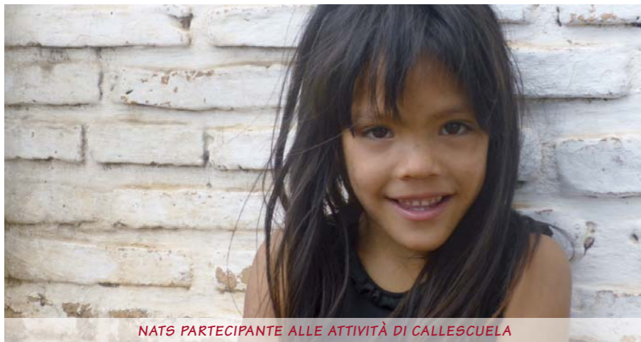
NATS PARTECIPANTE ALLE ATTIVITÀ DI CALLESCUELA