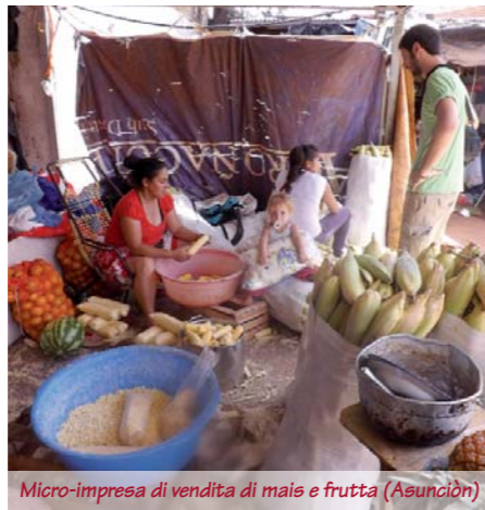
Micro-impresa di vendita di mais e frutta (Asunción)